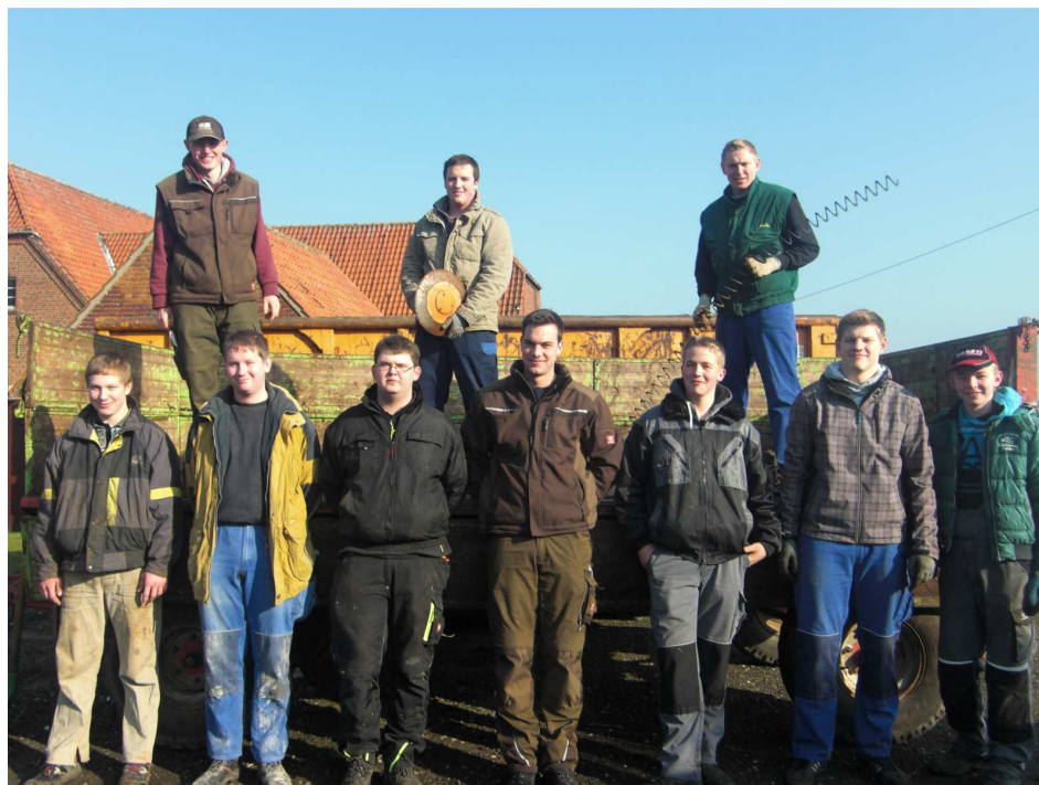
Die Landjugend Drensteinfurt holt am 16. März Schrott bei den Bürgern ab. Der Erlös kommt auch einem Kleinbauern-Projekt in Uganda zugute.

Anfang Januar ist in Drensteinfurt ein Entwicklungshilfeprojekt gestartet, das Kleinbauern im ostafrikanischen Uganda beim Aufbau einer genossenschaftlichen Vermarktung hilft. Die Katholische Landjugend in Drensteinfurt unterstützt das Projekt auch finanziell: Der Erlös der diesjährigen Schrottsammlung am 16. April geht zu einem Teil nach Afrika.