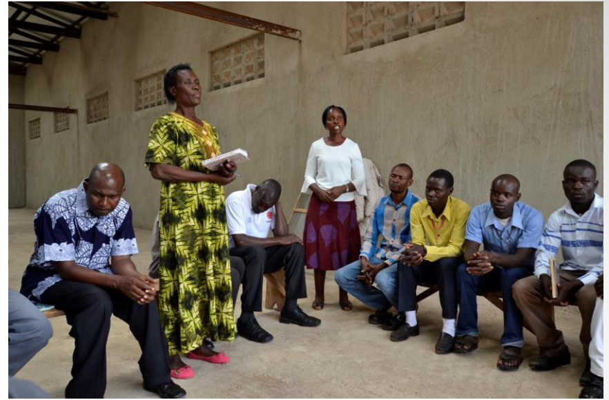
Markthalle zur Lagerung von Mais und anderen Früchten; genossenschaftliche Vermarktung; Anlage einer indigenen Saatbank (unten links)