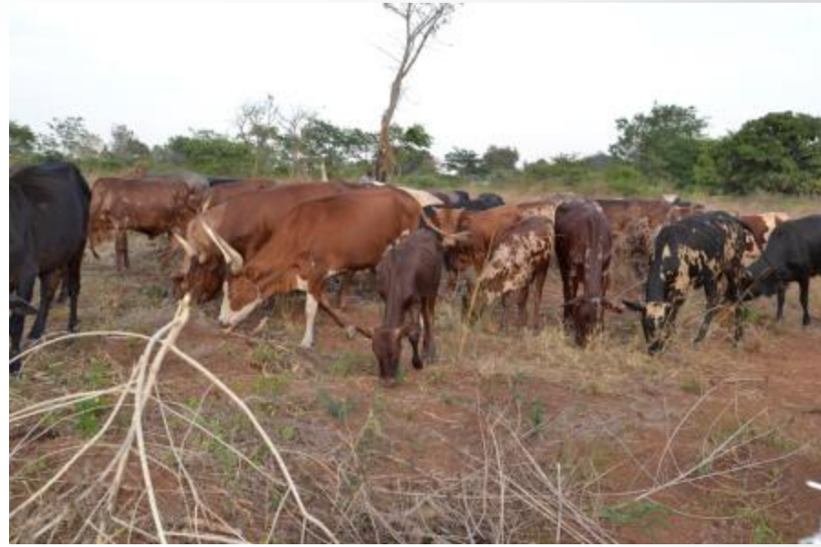
Demonstrationsfarmen Nakasongola-District + Cattle Corridor